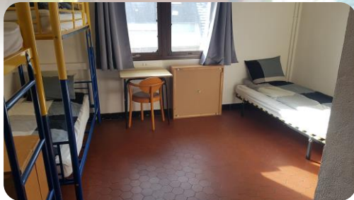
Espace de repos