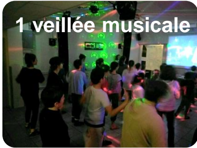
1 veillée musicale