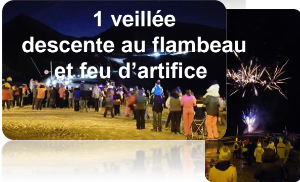
1 veillée descente au flambeau et feu d'artifice